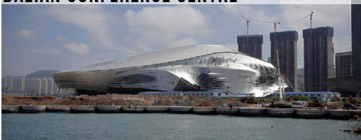
Coop Himmelb(l)au, Wien