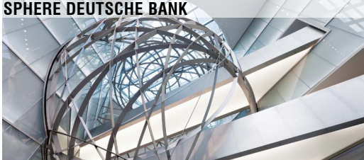
Mario Bellini, Mailand