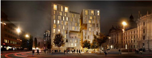
Nieto Sobejano Arquitectos, Madrid, Berlin