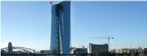
Coop Himmelb(l)au, Wien